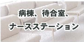
病棟、待合室、 ナースステーション